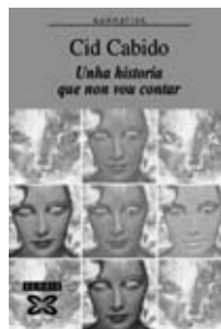
Cid Cabido_Unha historia que non vou contar_Xerais

As 16 cancións do disco abordan temas próximos aos máis novos, como a natureza, o mar, os animais ou o fogar, proporcionándolles vocabulario e fórmulas de expresión a través da música. Un libro-disco para ver, escoitar e cantar, tanto en familia como na escola, que se complementa cunhas espectaculares ilustracións elaboradas coa laboriosa técnica do linogravado a cargo do deseñador suízo afincado en Bueu, Marc Taeger.