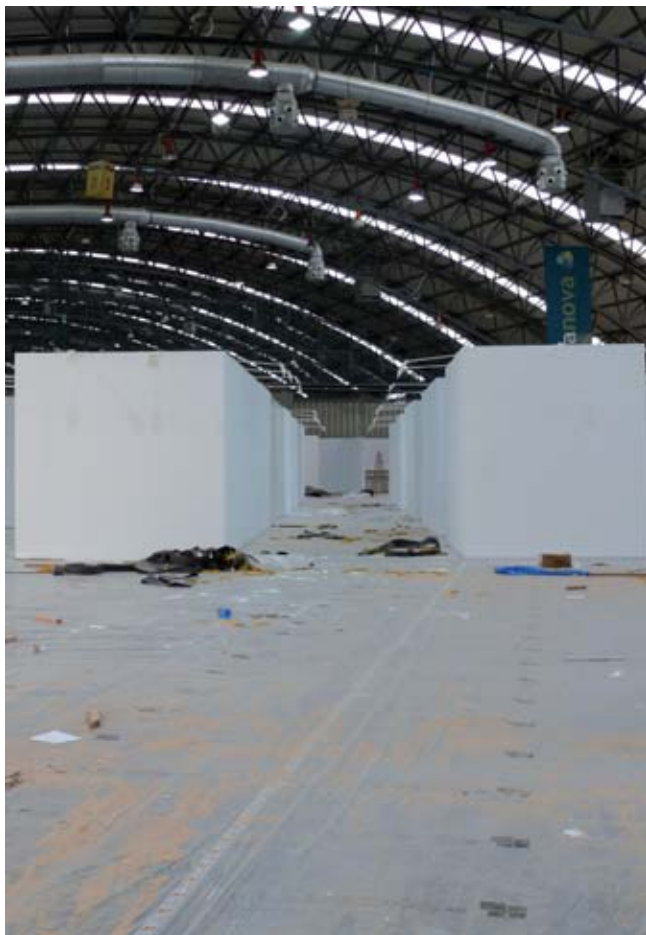
Vista xeral da montaxe da feira.